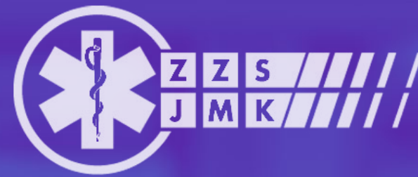
Zdravotnická záchranná služba Jihomoravského kraje